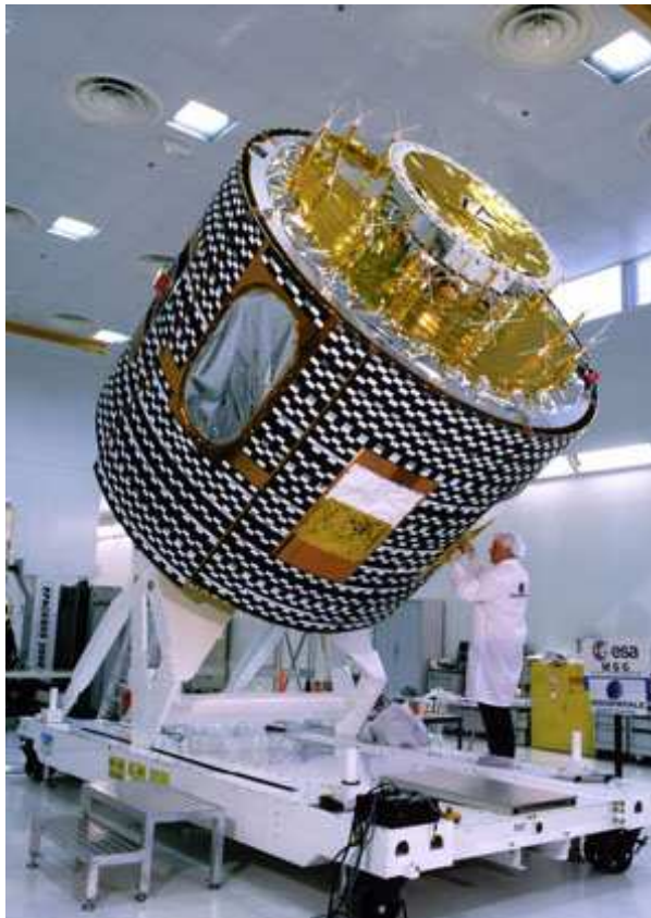
mikrometeregenaue Spiegeleinstellung im ESA-Meteosatellit MSG durch den Präzisionsschalter My-Com

Die My-Com Produktfamilie ist kompakt und überschaubar und viele Anwendungen lassen sich bereits mit dem standardmässig angebotenen Rundgehäusen mit Feingewinde und den quaderförmigen Ausführungen abdecken. In zahlreichen Applikationen ist jedoch nicht alleine die Gehäuseform Einsatzentscheidend, sondern zum Beispiel auch vermehrt die aufzuwendende Betätigungskraft, das Material und der Schliff der Tasts Spitze usw. Hier bietet der modulare Aufbau des My-Com Innenlebens eine hohe Flexibilität beim Ausarbeiten anwendungsspezifischer Anpassungen oder gar massgeschneiderter Kundenlösungen.