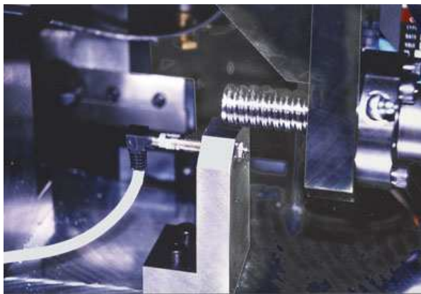
Der My-Com Präzisionsschalter im Einsatz auf einem Drehautomaten für Kleinteile

das nebenstehende Foto, welches an einem Drehautomaten für Kleinteile gemacht wurde, illustriert. Der in diesem Fall eingesetzte My-Com BS, gehalten in einem auffallend robusten und damit äusserst stabilen Montagewinkel, referenziert die Maschine in festgelegten Zeitintervallen neu. Dabei führt die sich drehende Gewindestange das Metallteil rechts im Bild langsam an die Tastspitze des My-Com heran, bis dieser anspricht und somit die exakte Position oder Ausgangslage der beweglichen Mechanik ermittelt werden kann. Die geforderte Schaltpunktgenauigkeit in dieser Anwendung beträgt 0,001 mm.